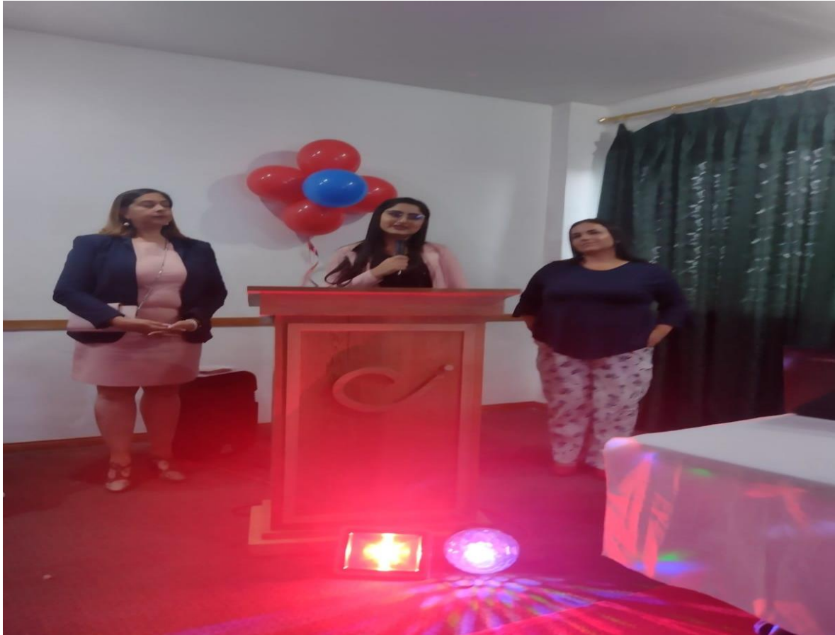
EXPOSICION DE MANTENIMIENTO